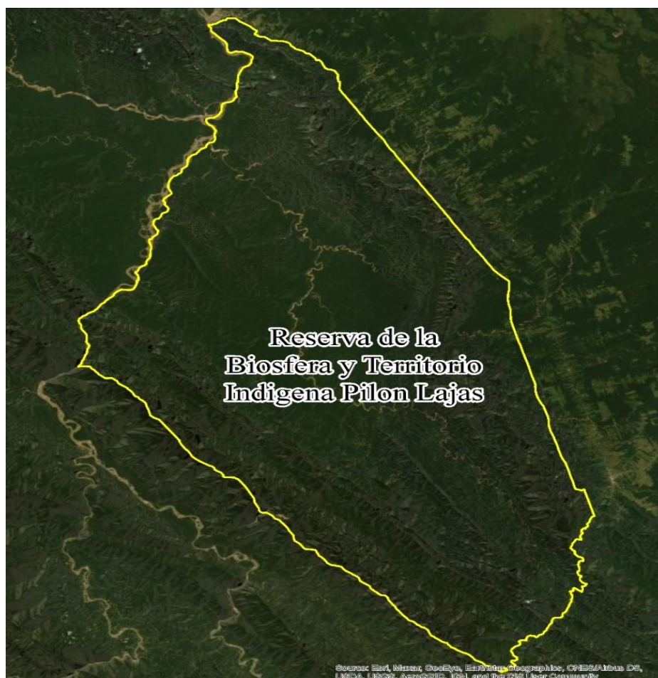
Mapa 1: Ubicación del CRTM dentro de la RESERVA DE LA BIOSFERA Y TIERRA COMUNITARIA DE ORIGEN PILON LAJAS

La TCO Pílon Lajas comprende las naciones Tacanas, Tsimán y Mosestén se ubica por la región sureste del departamento del Beni y centro este del departamento de La Paz, los municipios involucrados son: San Borja, Rurrenabaque así como los municipios de Apolo y Palos Blancos de la paz, con una superficie 400 000 has.