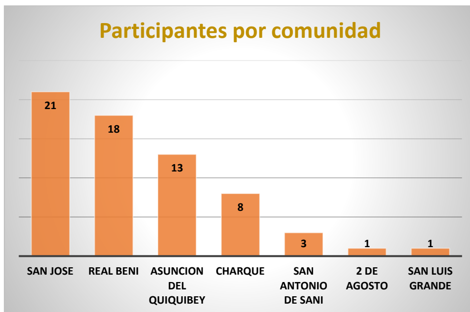
Gráfico 1: Participantes por unidad educativa dentro de la Reserva Pilon Lajas