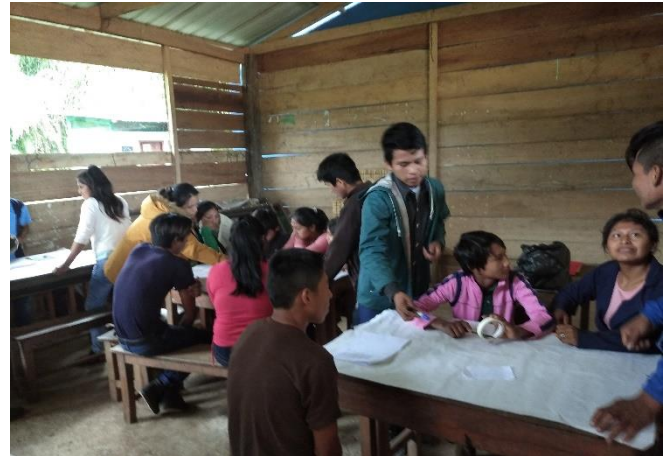
Taller en la Unidad Educativa San Jose de canan