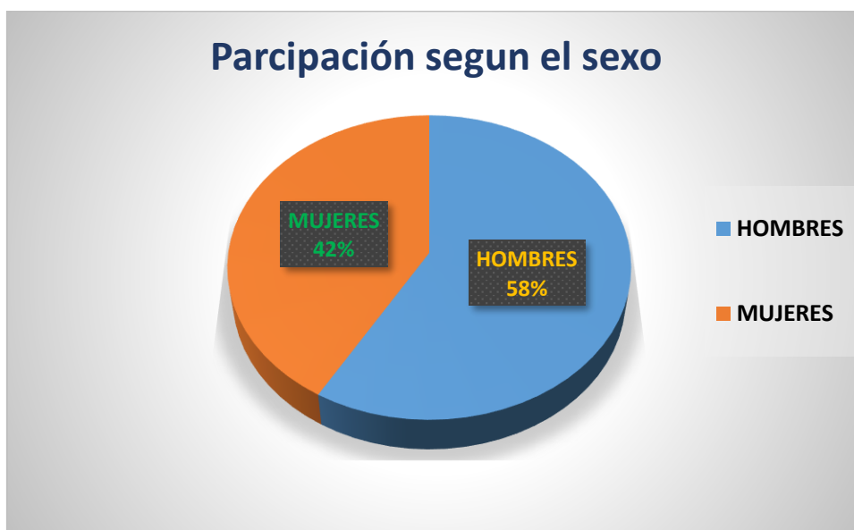
Gráfico 3: Participación por sexo en el taller